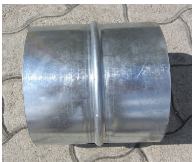
Innesto a cannocchiale

I tubi vanno collegati in testa tra loro mediante appositi giunti interni con innesto a cannocchiale.